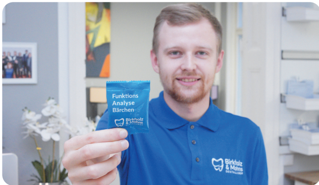
^ Besonderes Gimmick: Die Funktions Analyse Bärchen sind im zebris-Konzept enthalten.