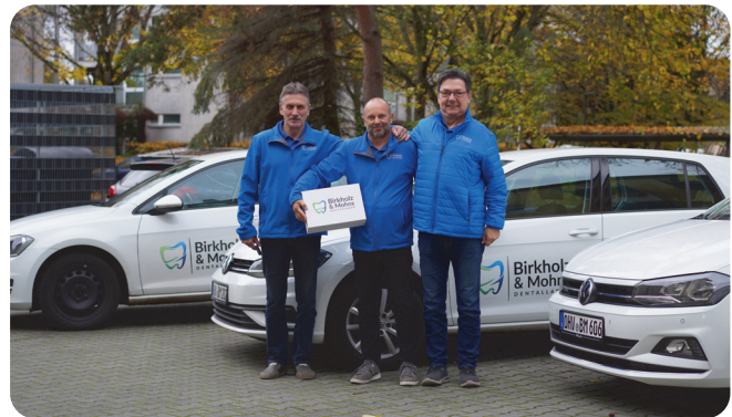
^ Just-in-time Lieferung der Versorgungen wird vom Botenteam garantiert.

ist natürlich auch ganz toll! Die Spanier sind immer ganz begeistert von der digitalen Zahntechnik. Wir zeigen ja auch so noch einiges von Deutschland. Dazu gehört ein Ausflug zur Meisterschule / Berufsschule ebenso wie der Aufenthalt in einer Zahnarztpraxis für 4 Tage.