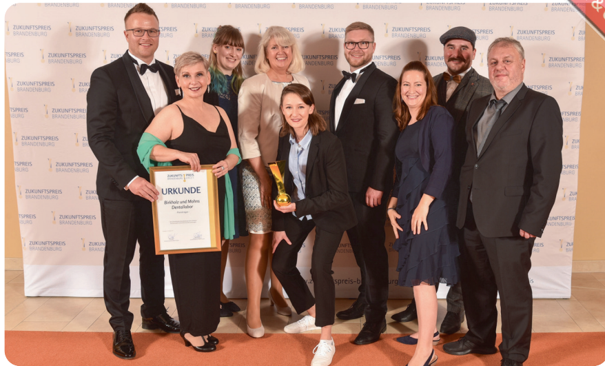
^ Das Team beim Galaabend zum Zukunftspreis Brandenburg 2021