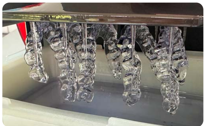
^ Mitarbeiter wurden zu Mitgestaltern und übernahmen das Modell-Management sowie die Fertigung aller Schienen und Abdrucklöffel.